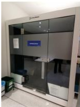
„Acoustic sofa” „Silent smartbox”