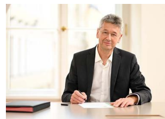
Kultusminister Prof. Dr. Michael Piazzolo